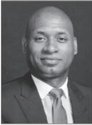
CHARLES M. BLOW

We knew this day would come. The New York Times reported on Thursday that a Republican "super PAC" was mulling over a plan to resurrect President Barack Obama's former pastor and spiritual adviser, the Rev. Jeremiah Wright Jr., as a weapon against the president. The proposal said that it would do what John McCain, whom it labels "a crusty old politician" (Ouch!), would not do in 2008. It called for using Wright to "increase the unease" and "in-flame the questions" among independents using the episode "that's never been properly exploited."